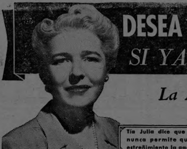
Tía Julia dice que ella nunca permite que el estreñimiento la agobie.

La Naturaleza Sabe, Mejor Que Nadie, Cómo Fomentar la Regularización Normal del Organismo