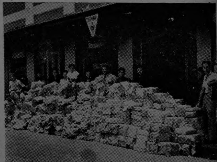
En esta fotografía puede apreciarse prácticamente la inmensa cantidad de revistas que semanalmente se reciben de Estados Unidos, Argentina, Méjico y Cuba, al comparar el montón de ellas con las personas que se encuentran de pie en la parte atrás de las mismas

A esta serie de publicaciones periódicas, agrega "La Casa de las Revistas" su sección de libros donde se encuentran ciencias, de artes, literarios, poéticos, novelísticos, obras de texto y las mejores producciones de la pluma mundial.